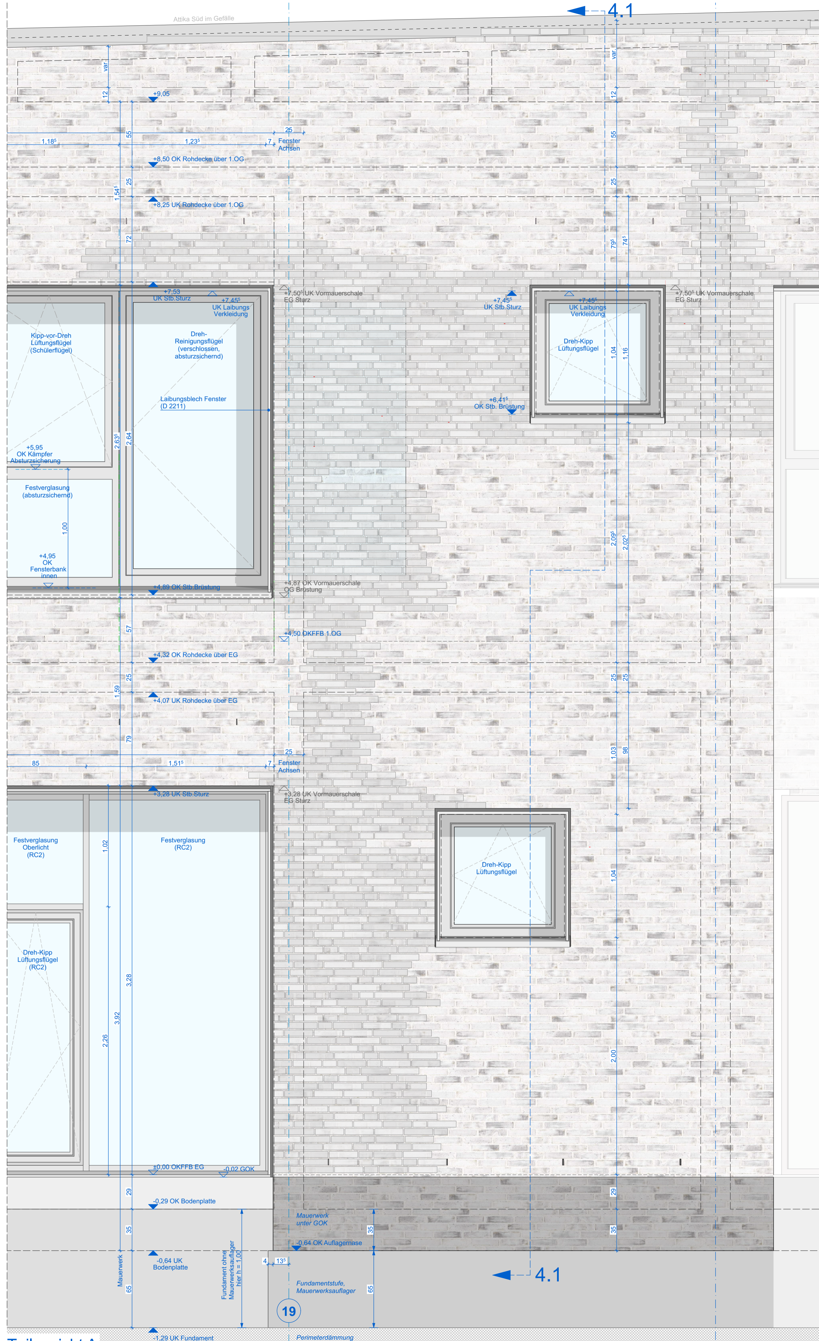
Teilansicht A M1:20